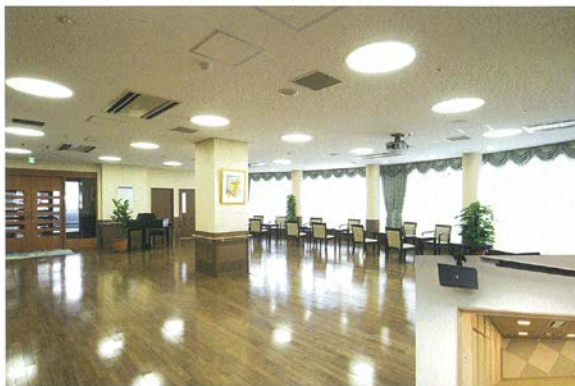
■地域交流センター